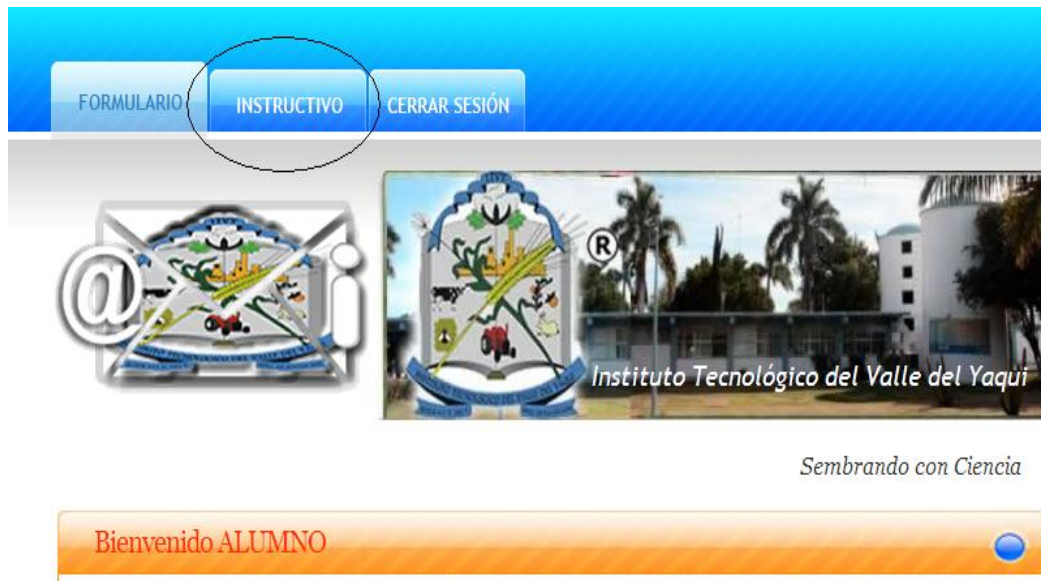
Fig. 3 Instructivo.

El instructivo para el llenado del formulario está en la pestaña de instructivo , Fig. 3