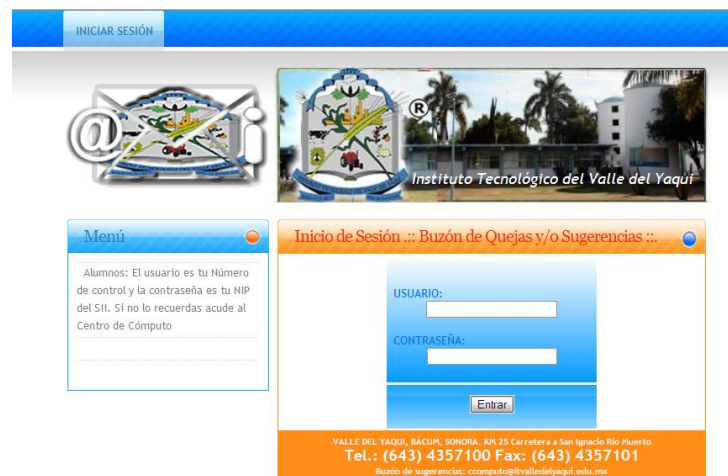
Fig. 2 Pantalla de inicio.

A continuación el sistema te mostrará su página de inicio, Fig 2.